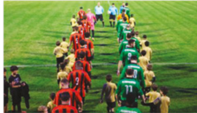
L'entrée des joueurs lors du match de coupe entre le F.C. du Confolentais et l'U.S. Lessac accompagnés des jeunes du GJLAC 16

Le F.C Confolentais remercie la commune d'Esse pour la mise à disposition de ses installations.