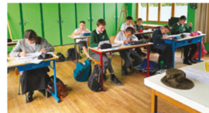
Une salle de classe

Plus qu'un simple établissement, le Cours Aliénor d'Aquitaine est véritablement un lieu vivant où chaque jeune trouve sa place et la tient, où la réussite de chacun contribue au dynamisme du collège.