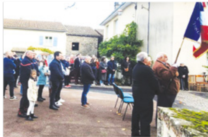
Une partie de la population présente