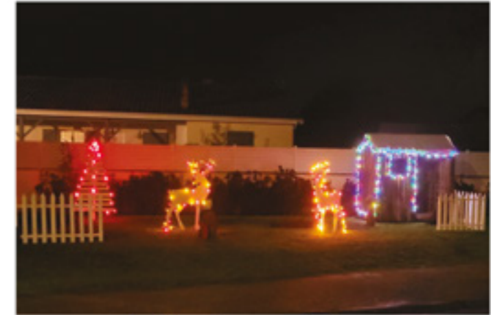
Les décorations au petit ruisseau

Cette année, le Conseil Municipal et les membres du Comité des Fêtes ont tenu à travailler de front afin d'embellir notre commune pour les fêtes. La commune s'est réveillée sous l'installation des décorations de Noël le samedi 29 novembre.