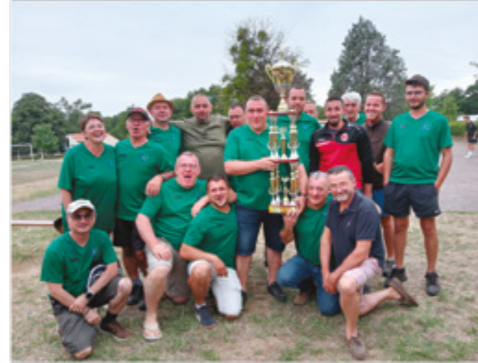
L'équipe d'Esse victorieuse à Brillac

L'équipe d'Esse remettait son titre en jeu, victorieuse l'an passé à Lesterps.