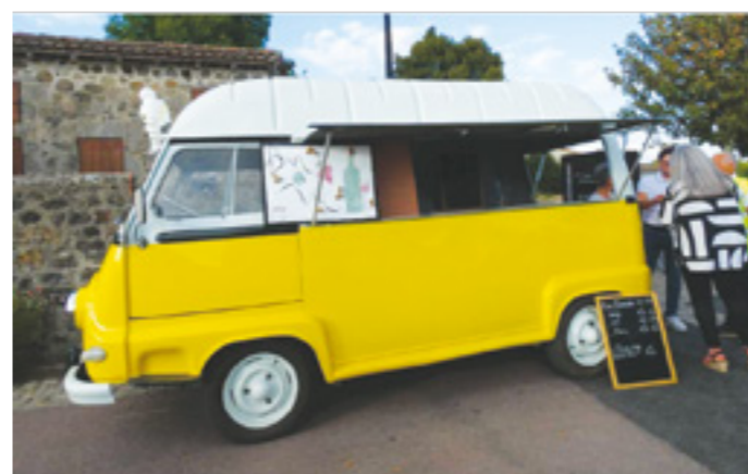
L'estafette présente pour l'eSta fête