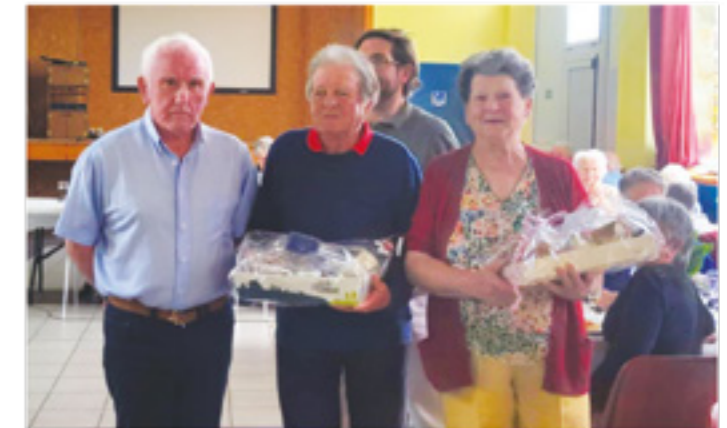
La remise des cadeaux

Au service, les élus et les agents ! En cuisine, l'équipe de l'Estaminet s'affaire après avoir été chaleureusement applaudie pour le 10 ème anniversaire du restaurant.