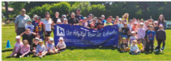
La course solidaire à Lessac

Notre association de parents d'élèves est toujours présente pour les enfants scolarisés sur le RPI Boreall. Nous accompagnons les enseignants à réaliser leur projet pédagogique tout au long de l'année scolaire.