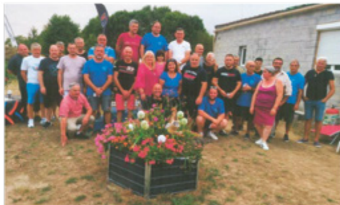
L'équipe des bénévoles

L'école de tir fonctionne toujours aussi bien et reçoit des jeunes et des moins jeunes tireurs pour s'initier au tir et au perfectionnement également.