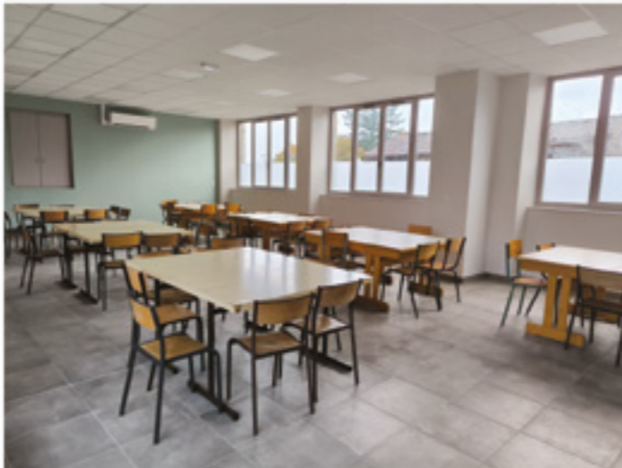
Le réfectoire réaménagé

Une nouvelle cuisine va voir le jour à l'emplacement de l'ancienne scène et de l'ancien bureau du maire. Elle disposera d'un accès direct sur la salle, offrant ainsi une utilisation plus fonctionnelle des lieux. L'ancien espace bar sera également réhaussé au niveau de la salle afin de répondre aux normes d'accessibilité.