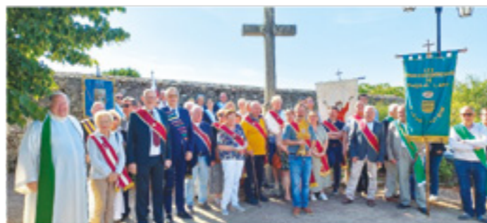
La confrérie avant la messe