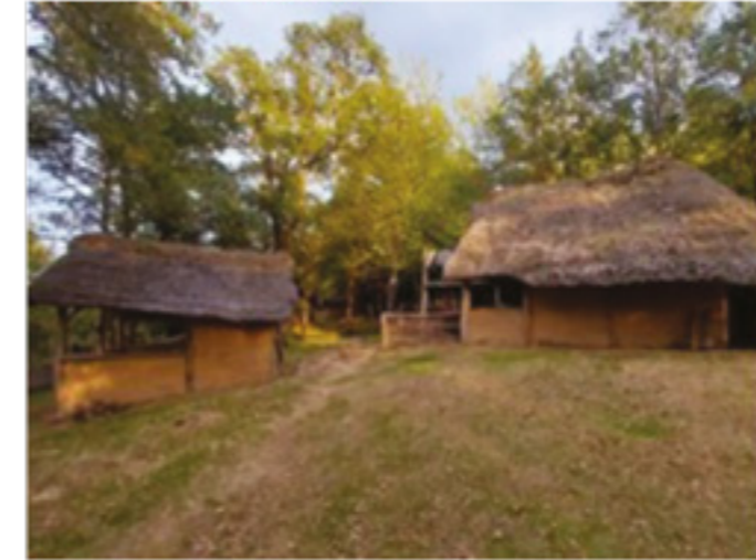
L'atelier verre et l'atelier poterie

Ces temps d'animation restent aussi le moment préféré de l'ensemble des bénévoles de l'association, qui peuvent vivre à Coriobona durant plusieurs jours, mais aussi échanger avec les 2300 visiteurs présents lors de ces journées, dans le but de transmettre les connaissances acquises à l'occasion de nos recherches et expérimentations archéologiques. L'association Les Gaulois d'Esse, c'est également une troupe de reconstitution historique qui se déplace partout en France et en Europe pour animer des sites archéologiques et musées, soit plus de 130 interventions à ce jour.