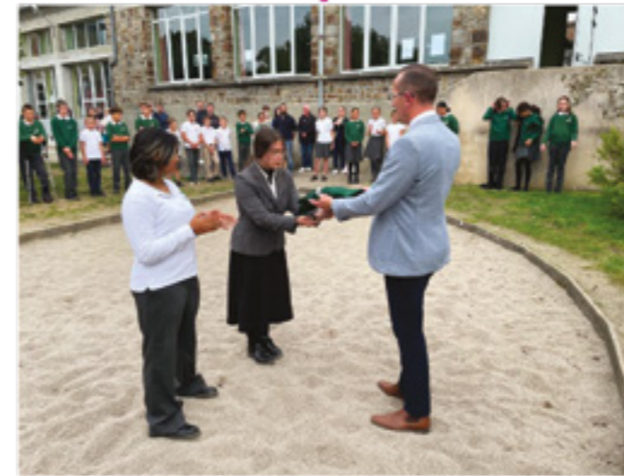
La remise des uniformes

Pour la quatrième année consécutive, le Cours Aliénor a fait sa rentrée en septembre et offre, comme déjà depuis un an, la possibilité d'un collège entier, de la 6 ème à la 3 ème .