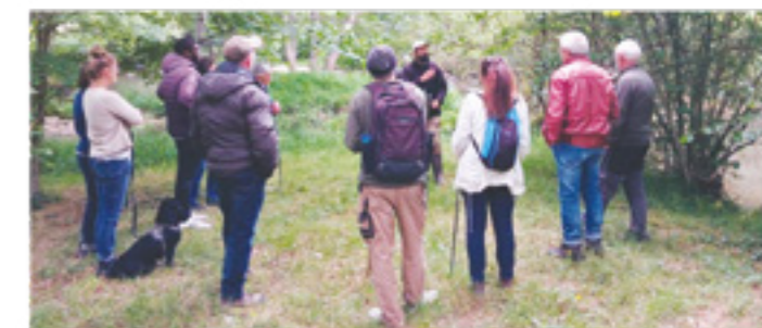
Visite de la vallée de l'Issoire

Pour en savoir plus sur le site Natura 2000 de la vallée de l'Issoire et découvrir les prochaines animations, rendez-vous sur : https://valleedelissoire.n2000.fr/