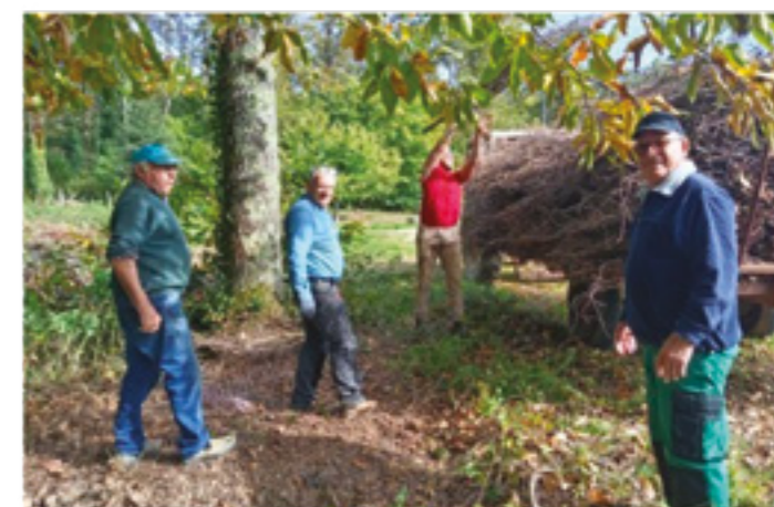
Ramassage en octobre et mise à l'abri des fagots pour le feu de Saint -Jean 2026

La date de l'assemblée générale n'est pas encore fixée mais nous vous tiendrons au courant. Et surtout n'hésitez pas à nous rejoindre, nous recherchons toujours des bénévoles !