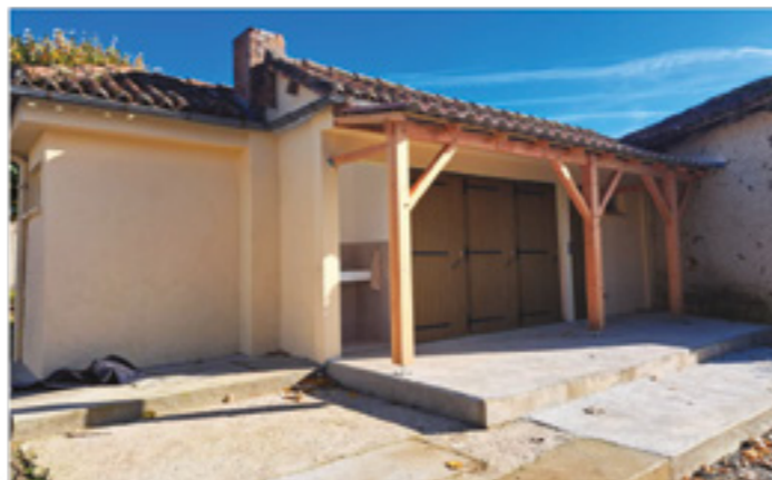
Les sanitaires extérieurs - vue du préau

Encore quelques mois de patience avant de pouvoir profiter pleinement de cette nouvelle salle des fêtes modernisée !