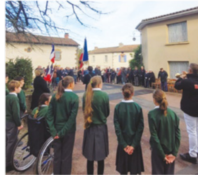
La population présente à la commémoration

La cérémonie débute dans une atmosphère solennelle, avec la lecture du message de l'Union Française des Associations de Combattants et de Victimes de Guerre (UFAC) par un collégien, et le message ministériel lu par Monsieur le Maire. Puis un hommage est rendu à chaque nom gravé sur notre monument avec l'appel des morts par un élève du collège.