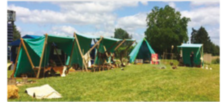
Le campement gaulois lors d'une prestation

le site de Paule (Côtes-d'Armor), que l'association envisage de reproduire. Au mois de novembre, le bâtiment de la poterie s'est vu déconstruire de l'un de ses murs porteurs ayant subi les dommages du temps. Cette problématique nous permet de tester les techniques de soutènement d'une structure de bâtiment telles qu'elles auraient pu être utilisées au 1 er siècle avant J.C.