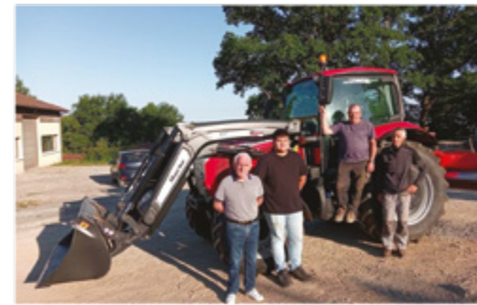
Le Maire et les employés devant le tracteur