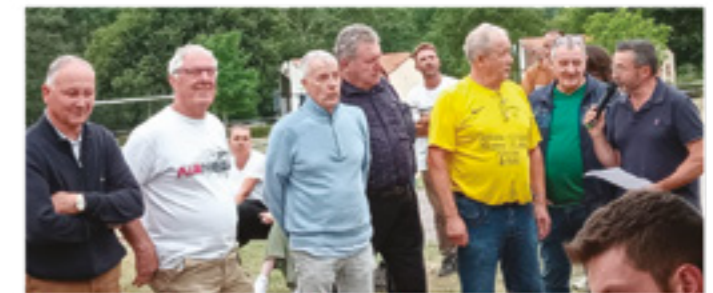
La remise des lots avec les représentants des communes