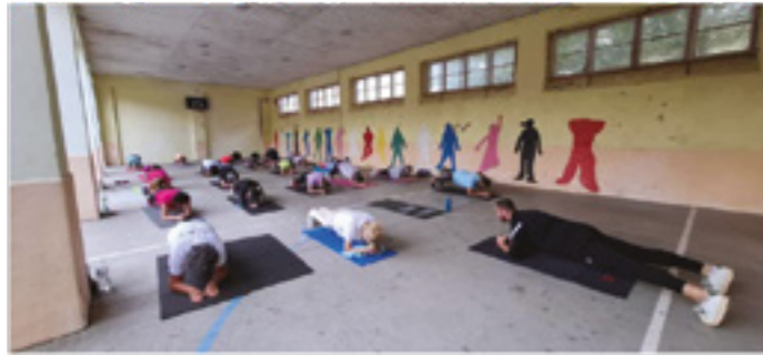
Une séance de gym

Gym pour tous : forme, bonne humeur et convivialité !