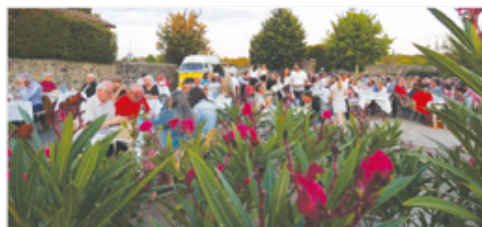
Le public pour le repas de l'eSta fête

Une nouvelle année s'achève et déjà l'ECPE travaille sur les événements de 2026. Mais revenons sur cette année riche en émotions avec ses trois rendez-vous. Un petit mot sur l'assemblée générale qui s'est déroulée le 31 janvier, quelques changements ont eu lieu.