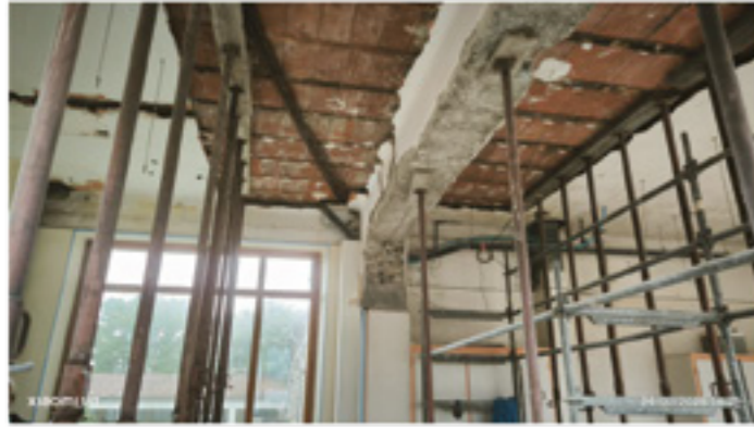
Sécurisation lors de l'ouverture du mur

Du côté de la rue des écoles, les travaux avancent à grands pas !