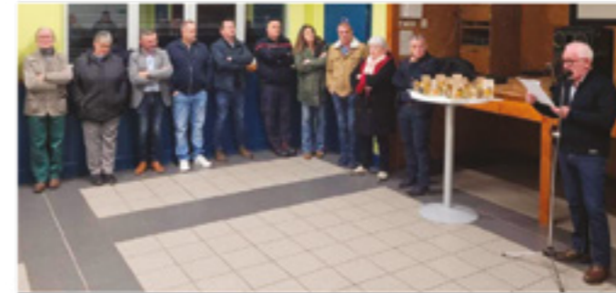
Les élus à la cérémonie des vœux