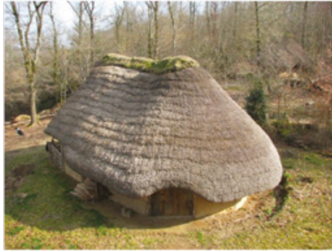
Une maison d'habitation