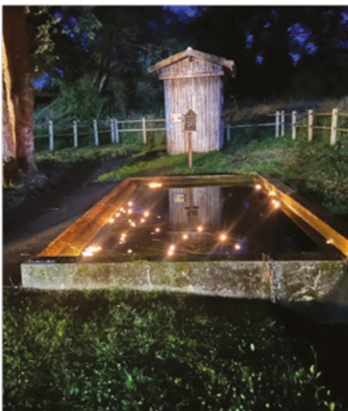
Le lavoir de La Cour lors du feu de Saint -Jean

Merci à tous, cette soirée est aussi une réussite grâce à vous !