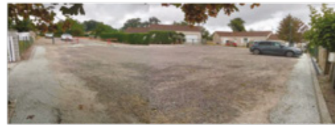
Place du lotissement les Cailles avant et après travaux