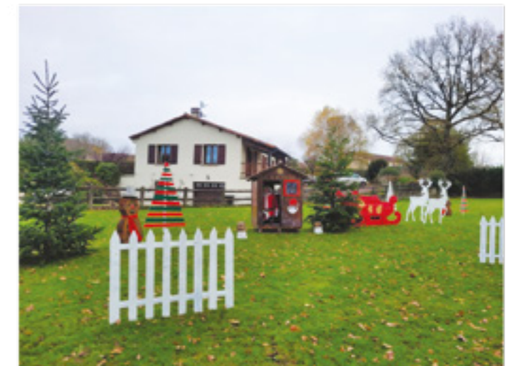
Les décorations route de Confolens

Des guirlandes lumineuses neuves ont aussi équipé une partie de ces sapins.