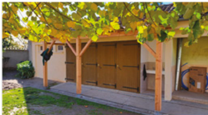
Les sanitaires extérieurs - vue de la salle des fêtes

Un grand merci à tous ces artisans pour la qualité de leur travail !