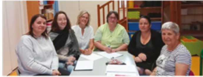
L'équipe de l'école de Brillac