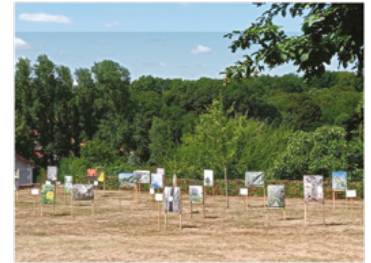
L'exposition dans le jardin du presbytère

Nous sommes fiers des retours, tant des habitants que des visiteurs / touristes, qui ont su apprécier cet hymne à la ruralité, à la Nature que nous souhaitons transmettre.