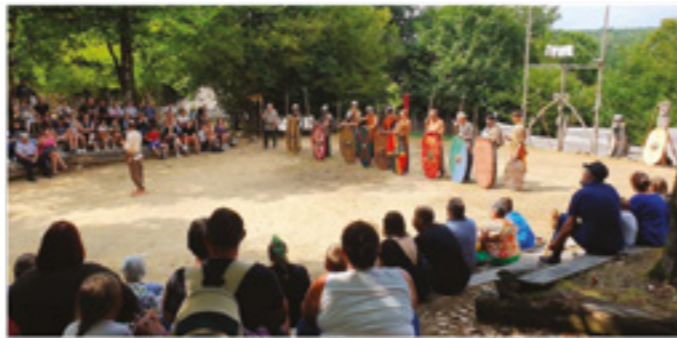
Une présentation de l'armement celte dans l'hémicycle

Des initiations à la poterie se sont vues proposées au grand public, tous les vendredis matin sur réservation, afin de transmettre nos connaissances artisanales sur les techniques de fabrication de céramique. Plus de 2300 personnes ont pu satisfaire leur curiosité et leur envie d'apprendre cette saison.