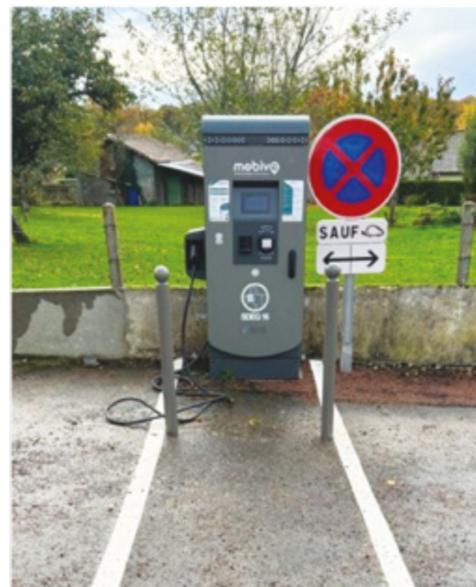
La borne de recharge sur la place des Tilleuls